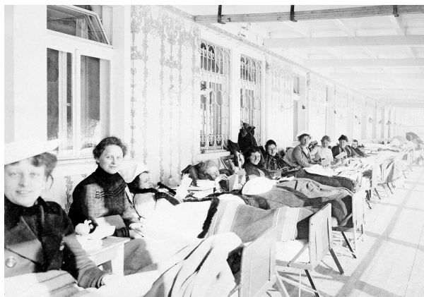
Viele Rehakliniken wie hier in Davos wurden ursprünglich als Heilanstalten für Tuberkulosekranke gegründet.